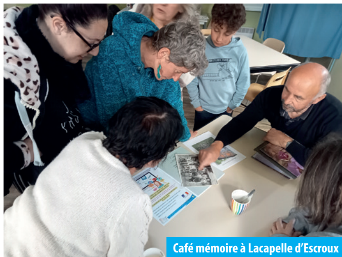
Café mémoire à Lacapelle d'Escroux

Des ateliers parentalité, santé/bien-être et numériques ont pu être proposés dans les différents villages de la CC, ainsi que des moments d'échanges conviviaux, notamment grâce à l'implication des habitants et à la participation bénévoles des partenaires du territoire.