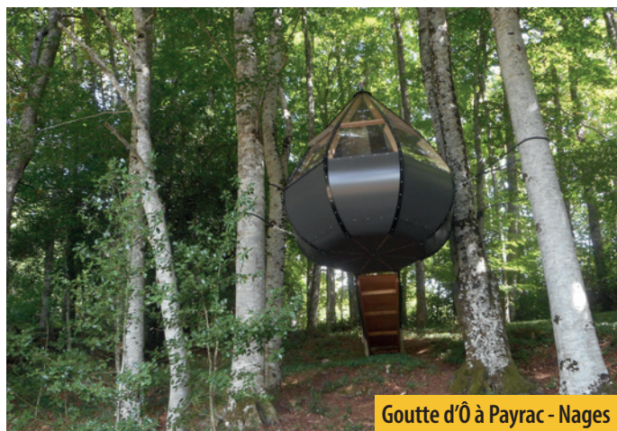
Goutte d'Ô à Payrac - Nages

La taxe de séjour sur les hébergements touristiques est perçue sur toutes les communes de la Communauté de Communes, toute l'année.