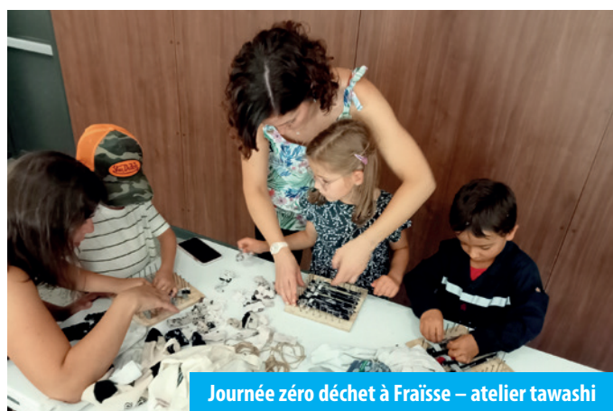
Journée zéro déchet à Fraïsse – atelier tawashi